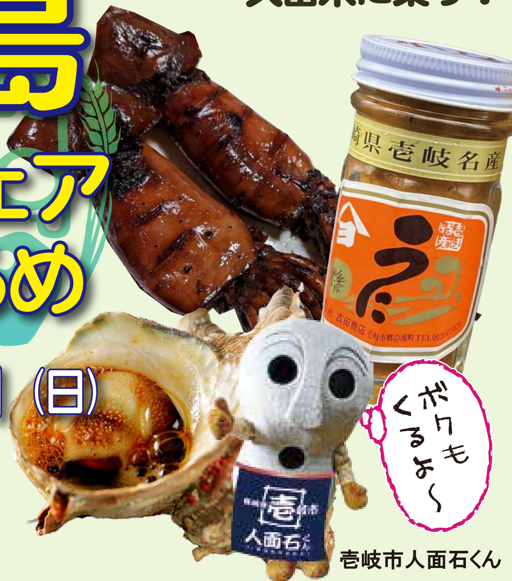
壱岐市人面石くん