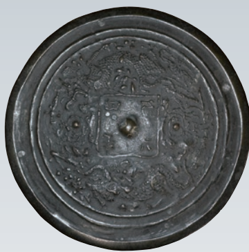
「至元四年」銘双龍文鏡 [個人蔵]