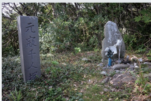
天々原千人塚 (勝本町仲触)