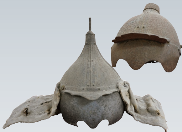
伝蒙古兵鉄兜 [長崎県立対馬高等学校 蔵]